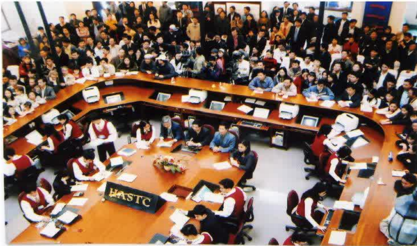
Một phiên giao dịch tại sàn chứng khoán Hà Nội