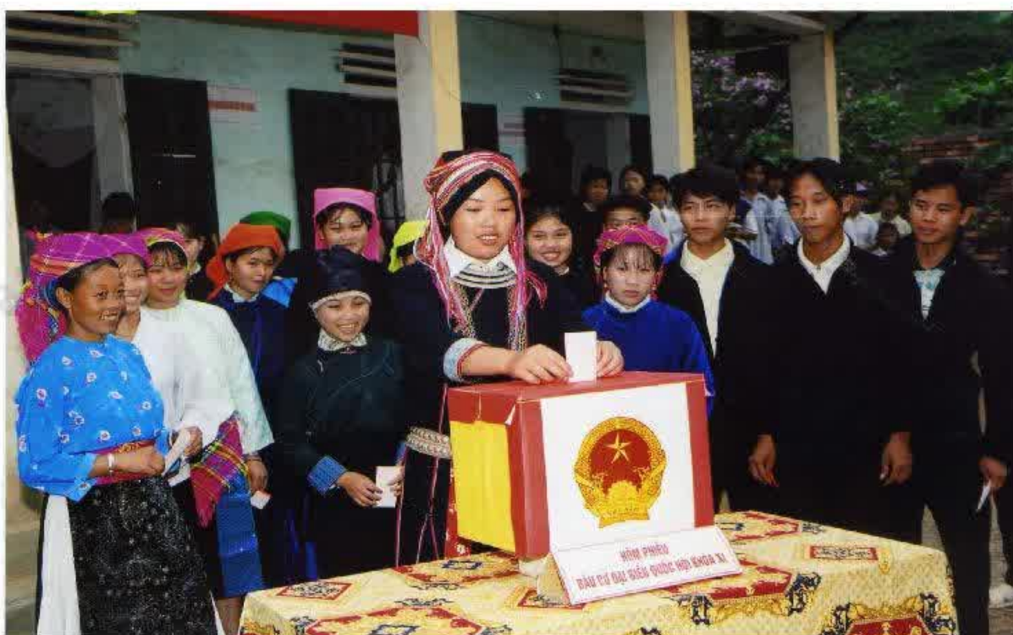
Nhân dân thị trấn Mèo Vạc, Hà Giang tham gia bỏ phiếu bầu đại biểu Quốc hội khoá XI