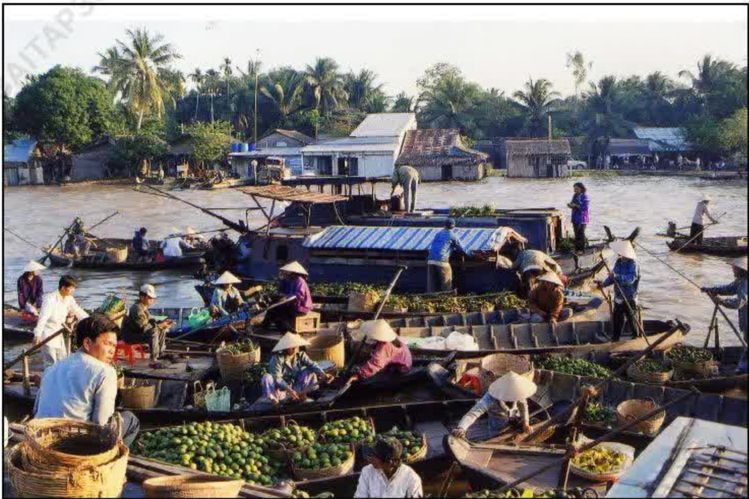
Chợ nổi ở đồng bằng sông Cửu Long

căn cứ quan trọng giúp cho người bán đưa ra các quyết định kịp thời nhằm thu nhiều lợi nhuận ; còn người mua sẽ điều chỉnh việc mua sao cho có lợi nhất.