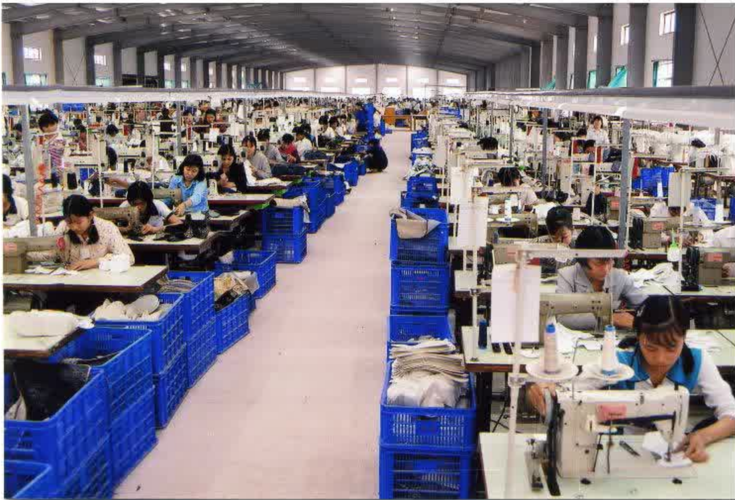
Công ti sản xuất giày Thanh niên xung phong Hải Phòng

Trong đời sống xã hội, loài người có nhiều mặt hoạt động như hoạt động kinh tế, chính trị, văn hoá, khoa học... Các hoạt động này ngày càng phong phú, đa dạng. Để tiến hành các hoạt động nói trên, trước hết con người phải tồn tại. Muốn tồn tại, con người phải có thức ăn, đồ mặc, nhà ở, phương tiện đi lại và nhiều thứ cần thiết khác. Để có những thứ đó, con người phải sản xuất và sản xuất với quy mô ngày càng lớn. Xã hội sẽ không tồn tại nếu ngừng sản xuất ra của cái vật chất.