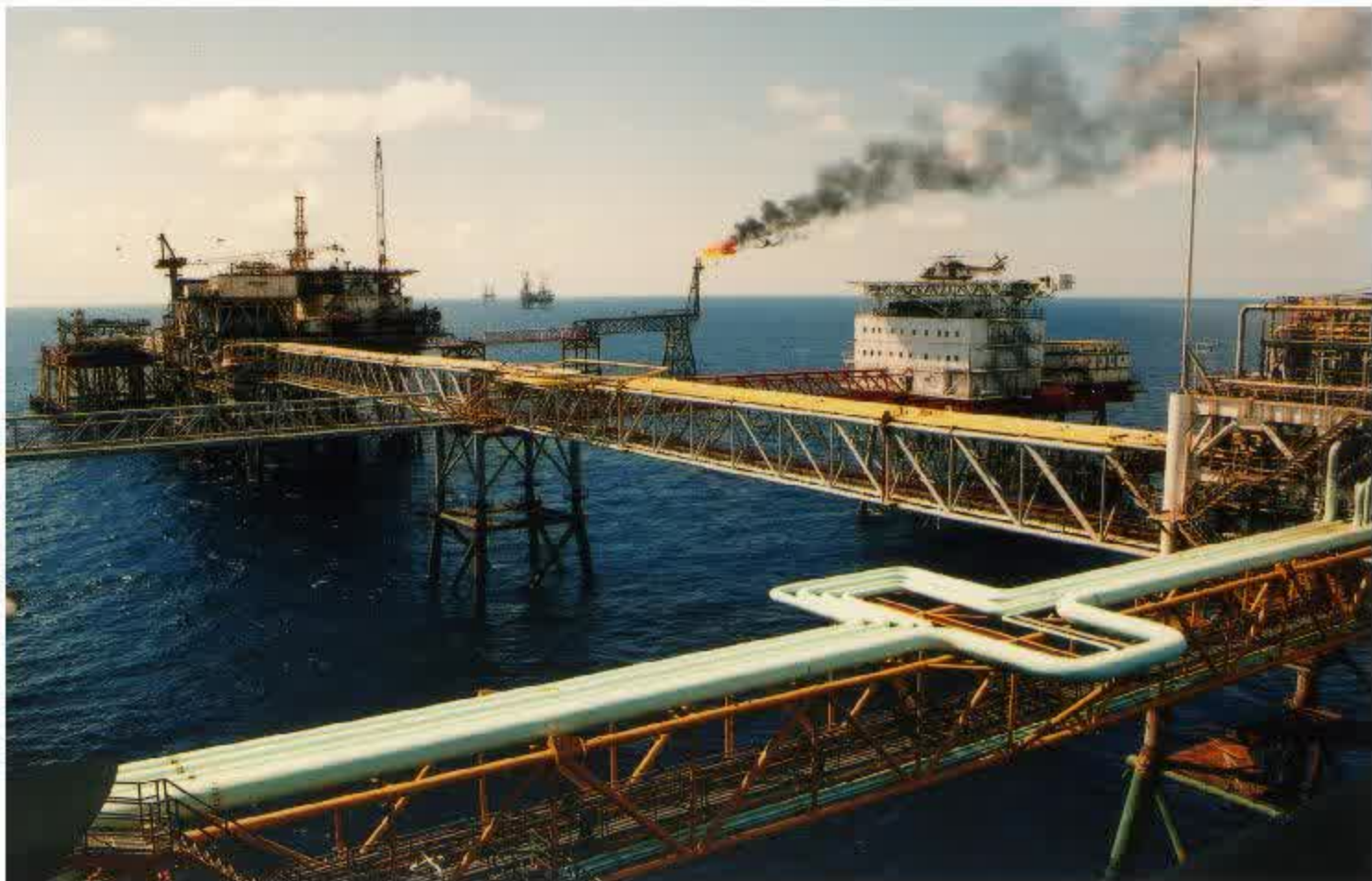
Mỏ dầu Bạch Hổ – Liên doanh dầu khí Việt-Xô