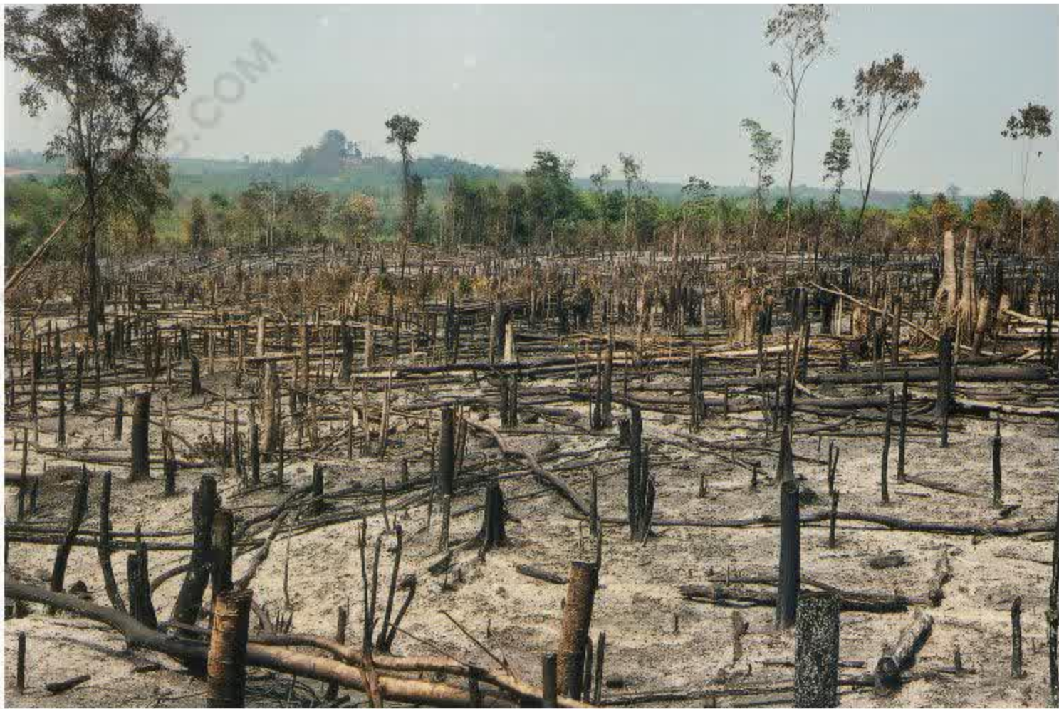
Cảnh rừng bị tàn phá