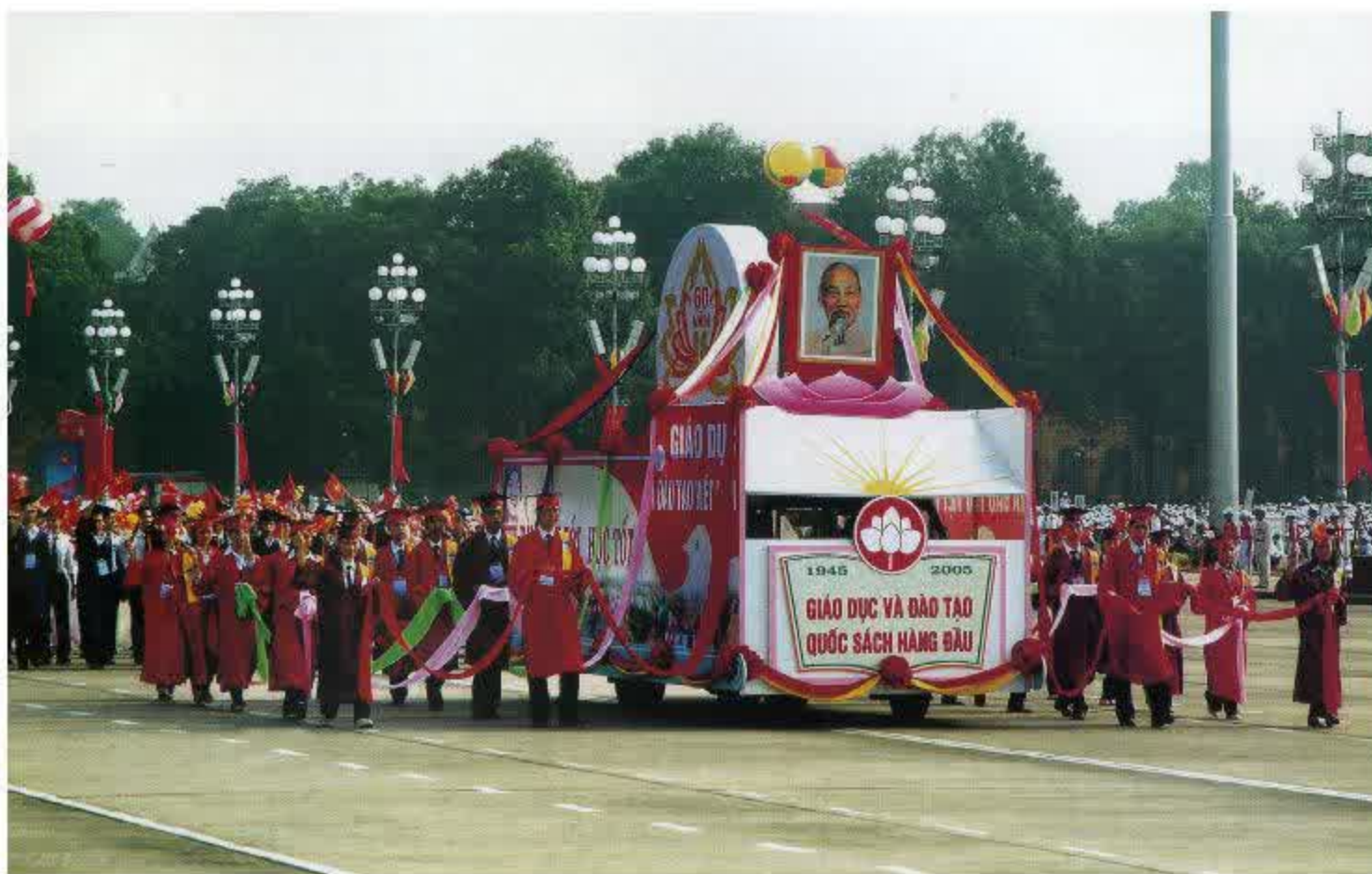
Diễu hành của ngành Giáo dục và Đào tạo

– Ưu tiên đầu tư cho giáo dục. Nhà nước huy động mọi nguồn lực để phát triển giáo dục và đào tạo, xây dựng cơ sở vật chất cho các trường học, thực hiện chuẩn hoá, hiện đại hoá nhà trường.