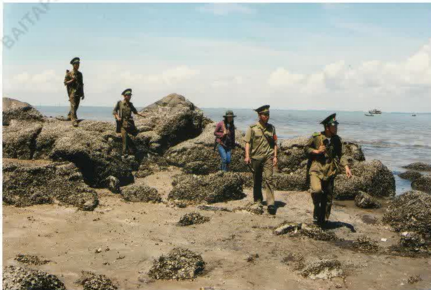
Tuần tra, kiểm soát trên biển

tổng hợp của dân tộc và sức mạnh thời đại. Sức mạnh tổng hợp do nhiều yếu tố tạo nên, nhưng yếu tố có ý nghĩa quyết định là sức mạnh dân tộc, con người, chính trị, tinh thần mà biểu hiện tập trung ở sức mạnh của khối đoàn kết toàn dân, của cả hệ thống chính trị dưới sự lãnh đạo của Đảng.