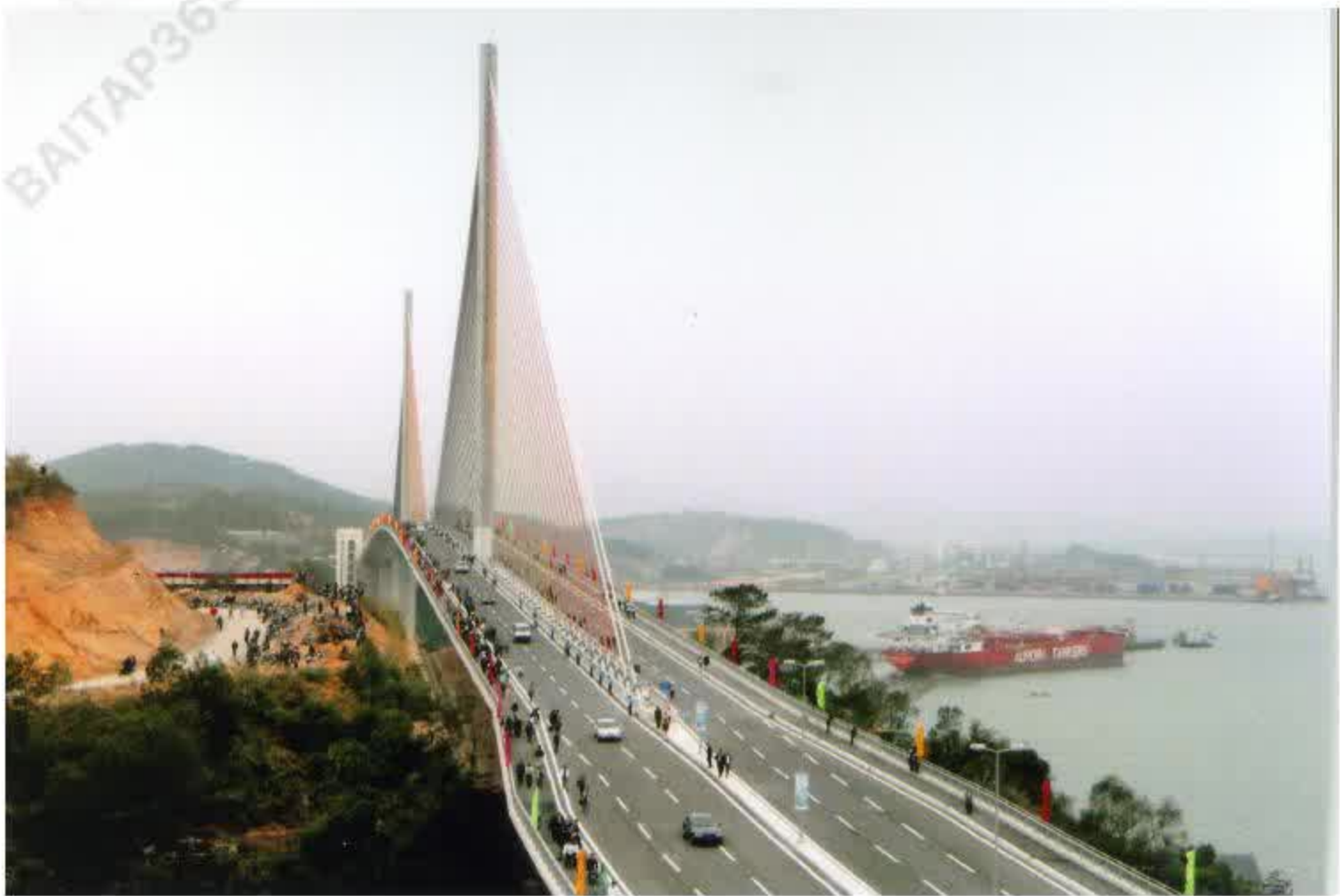
Cầu Bãi Cháy bắc qua eo biển Cửa Lục (thành phố Hạ Long – Quảng Ninh) nằm trên trục giao thông huyết mạch của vùng kinh tế trọng điểm phía Bắc.

sản xuất và quan hệ sản xuất xã hội chủ nghĩa trong quá trình công nghiệp hoá, hiện đại hoá ở nước ta.